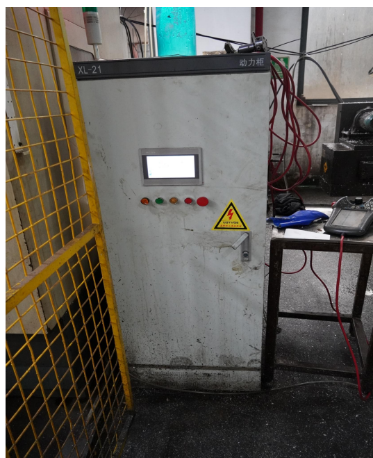
图三 事发机械手操作器、控制柜

工作站日常一直处于开启状态且全自动运行,安排 1 名操作工(分日夜两班次);操作工职责仅是在工作站外侧负责上下料,不负责操作设备;日班作业前,需要对工作站的密封机进行密封